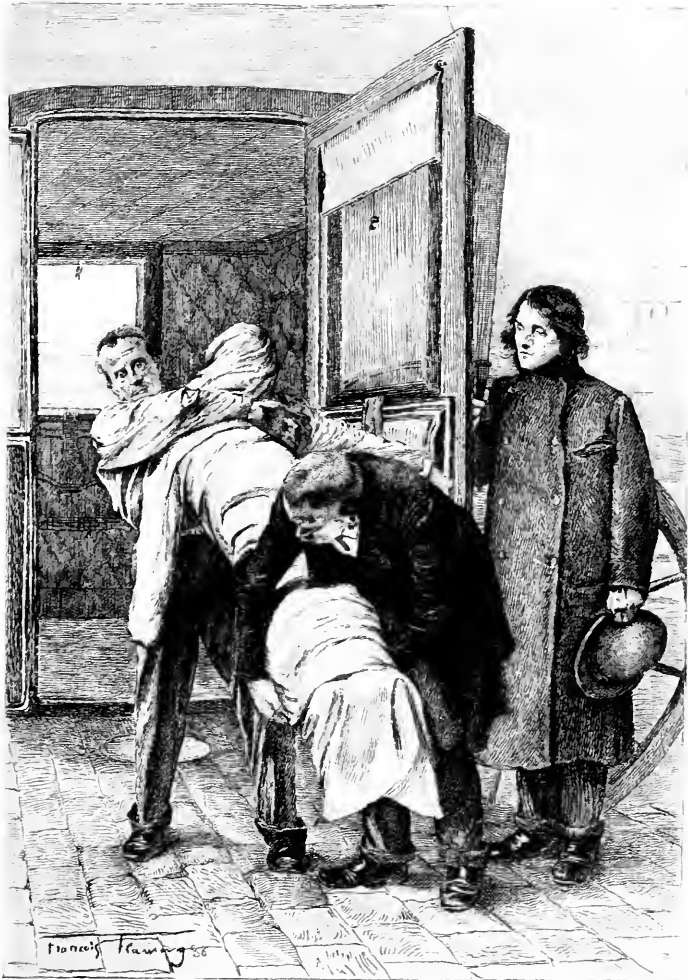
LE CADAVRE DE BAUDIN